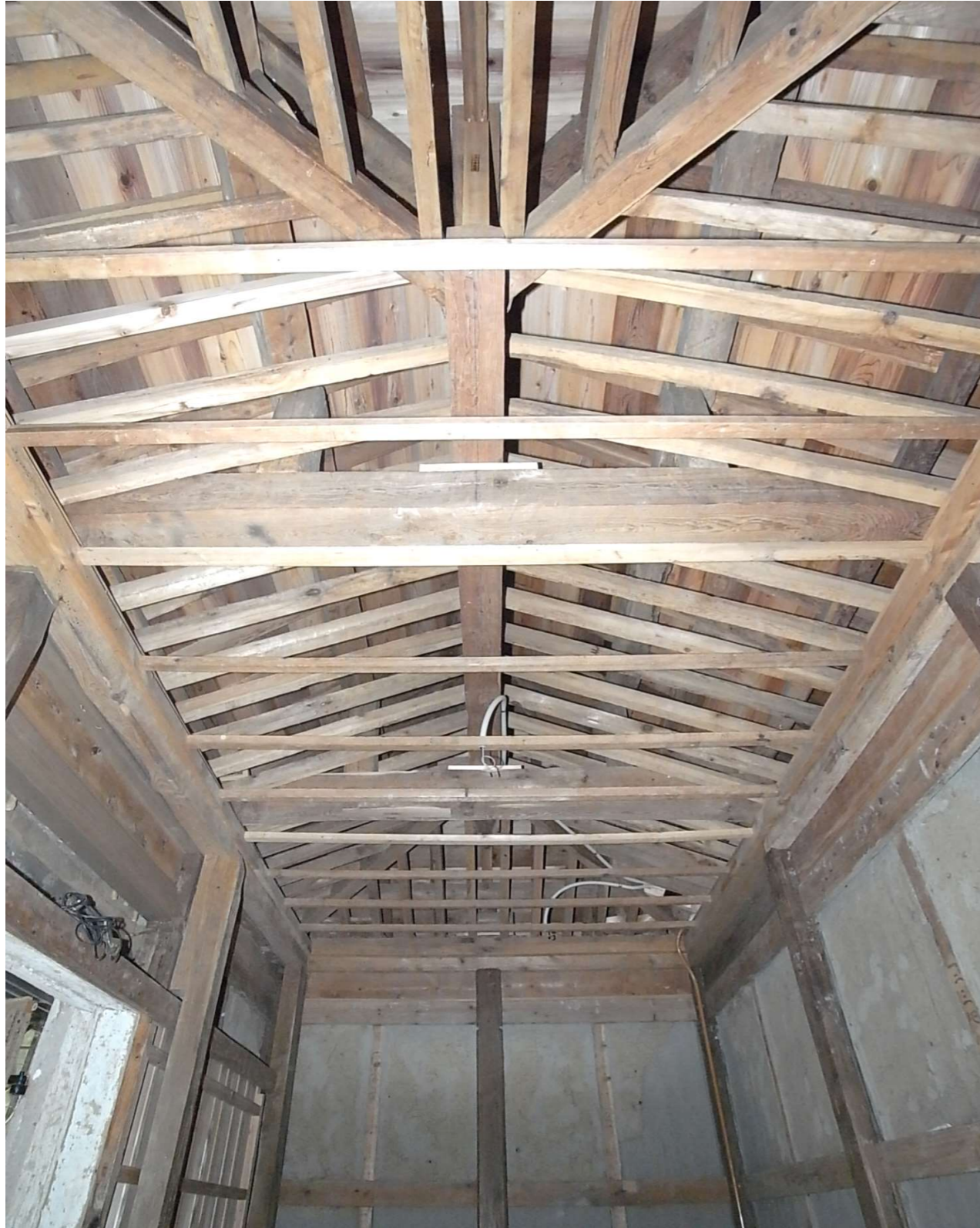
組立03 天井復旧中(左官工事11と同日)